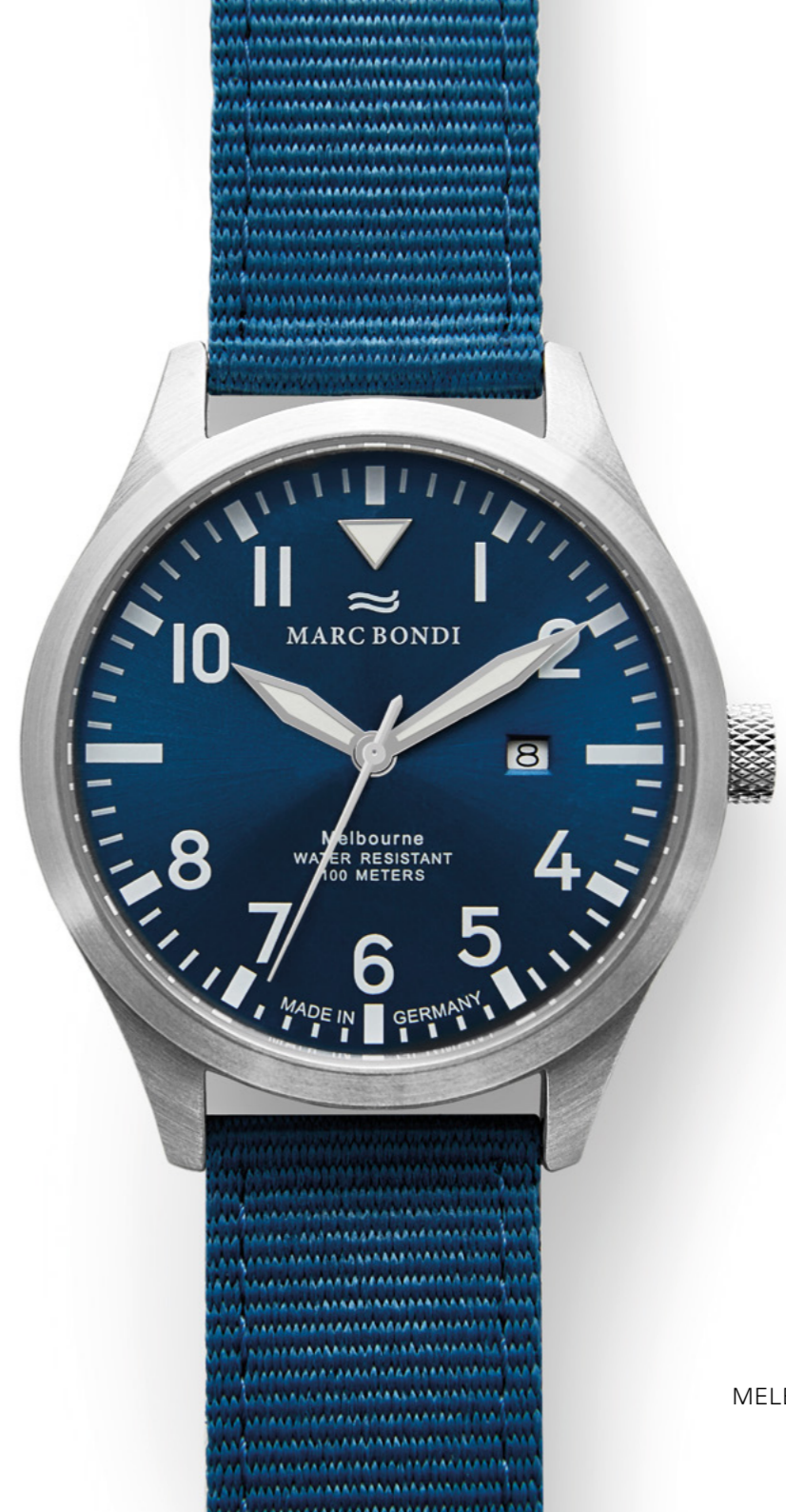
MELBOURNE, Ø 42 mm