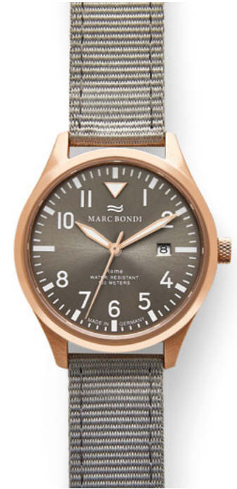
ROME, Ø 38 mm