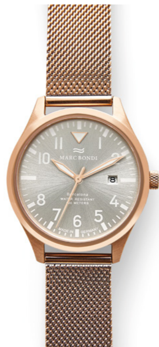
BARCELONA, Ø 38 mm