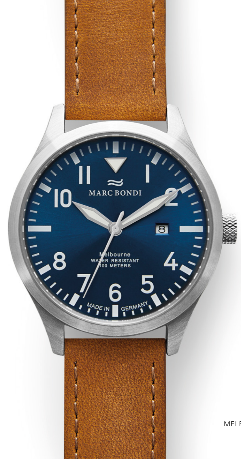
MELBOURNE, Ø 42 mm