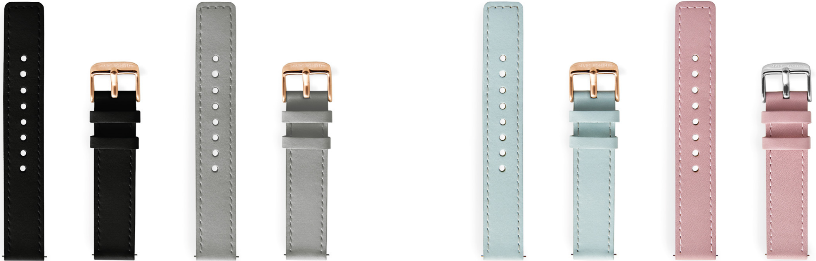
Lederband, Anstoßbreite 18 mm