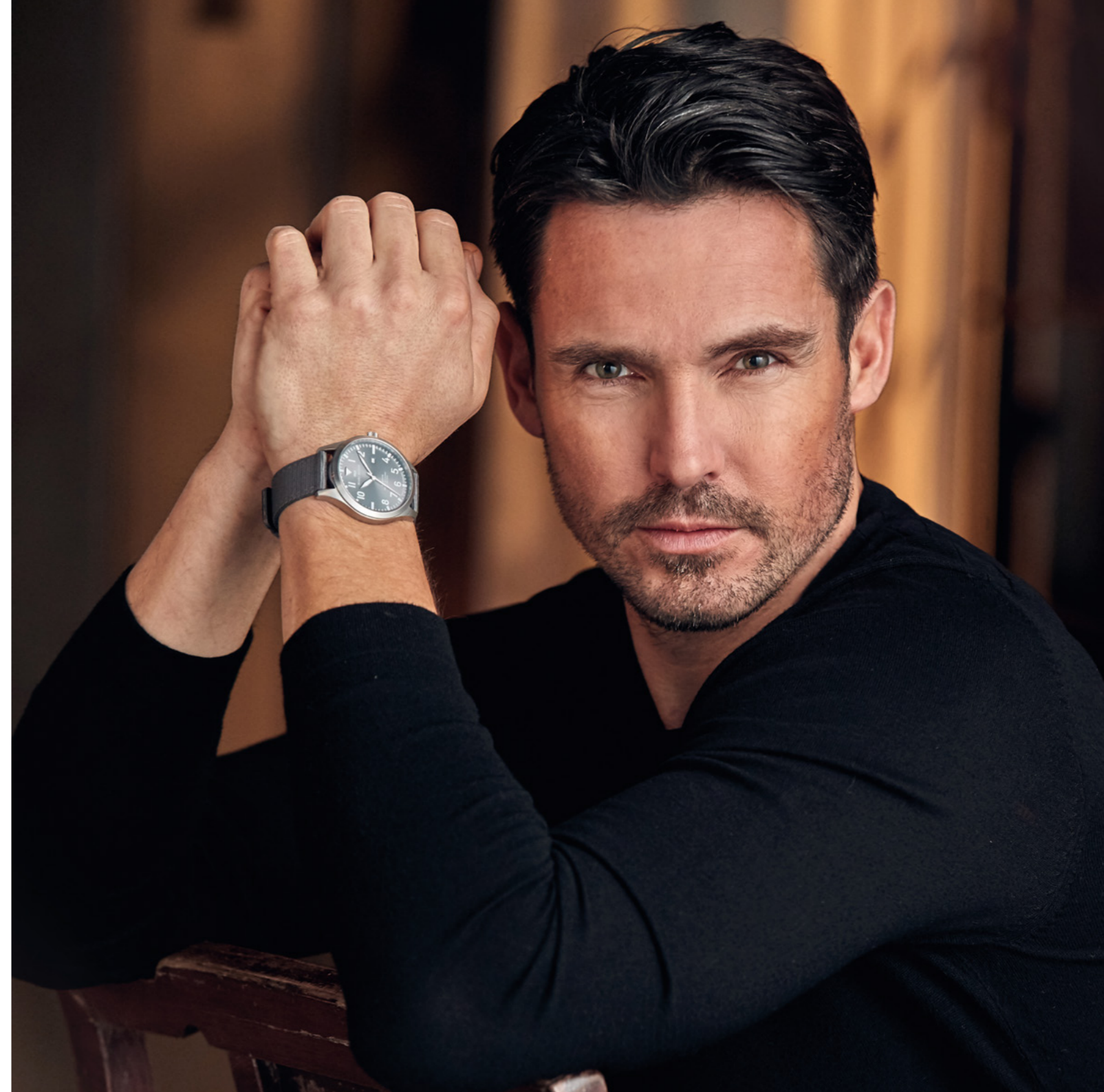
SINGAPORE, Ø 42 mm