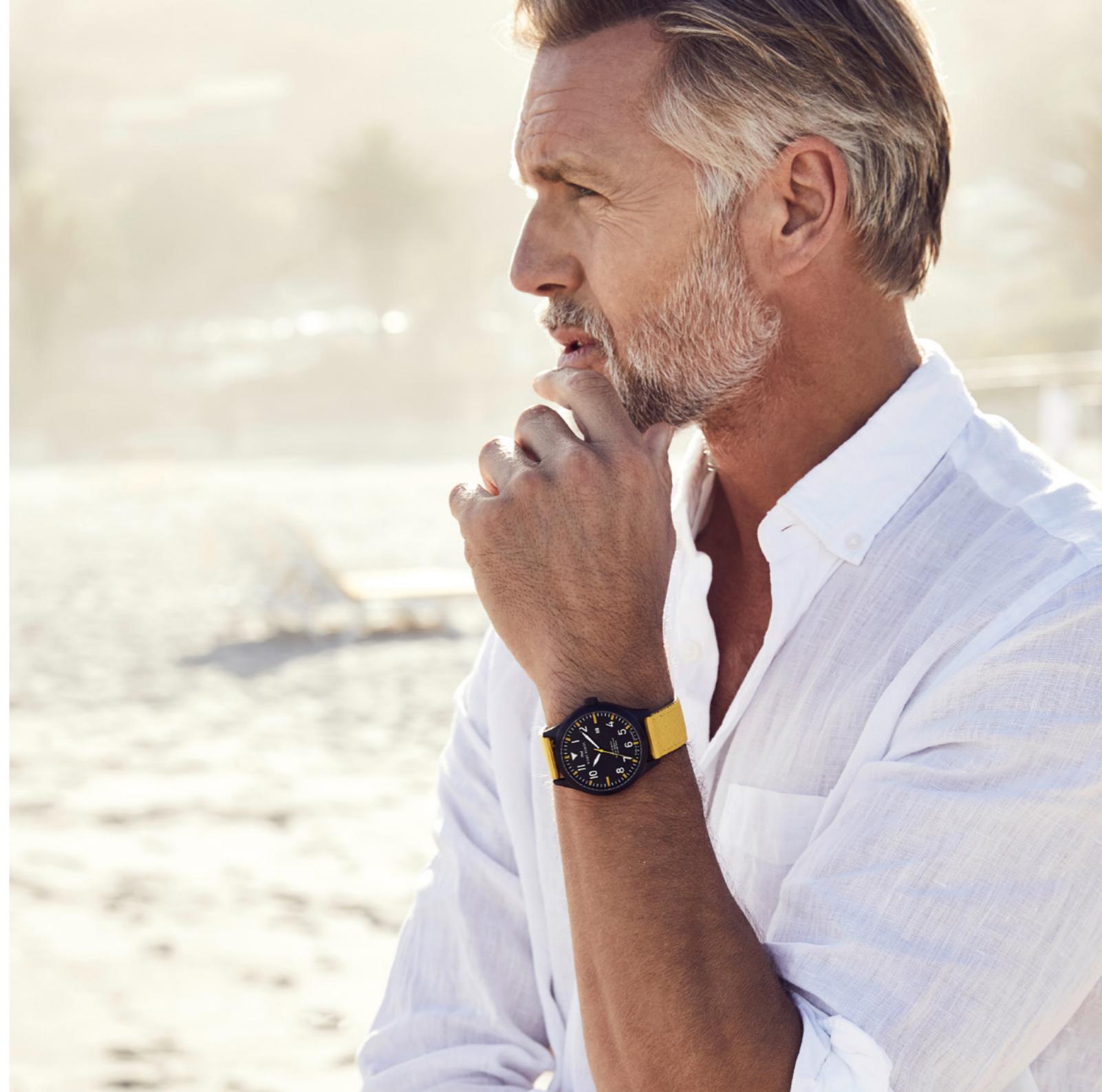
LOS ANGELES, Ø 42 mm