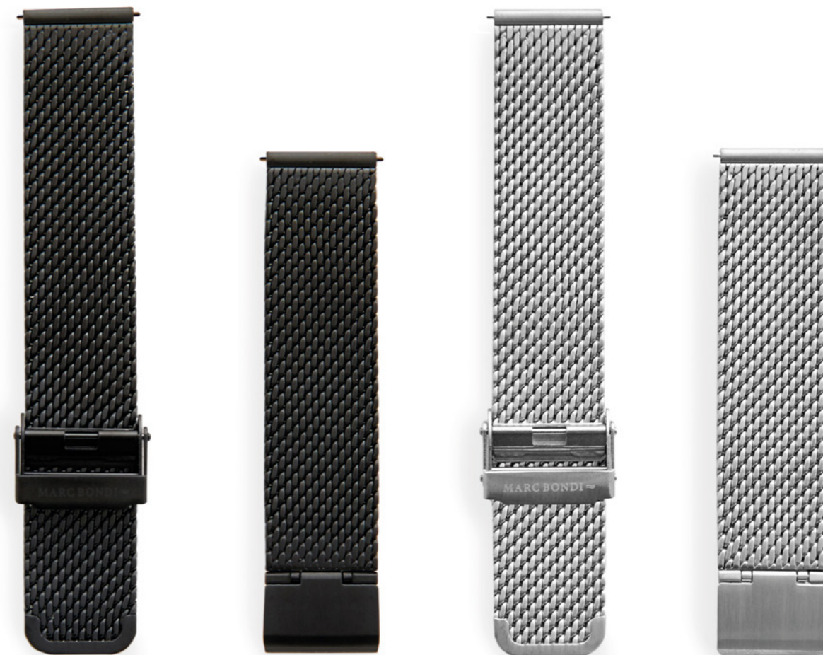
Meshband, Anstoßbreite 20 mm