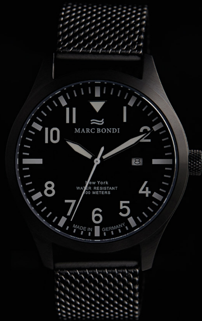
NEW YORK, Ø 42 mm