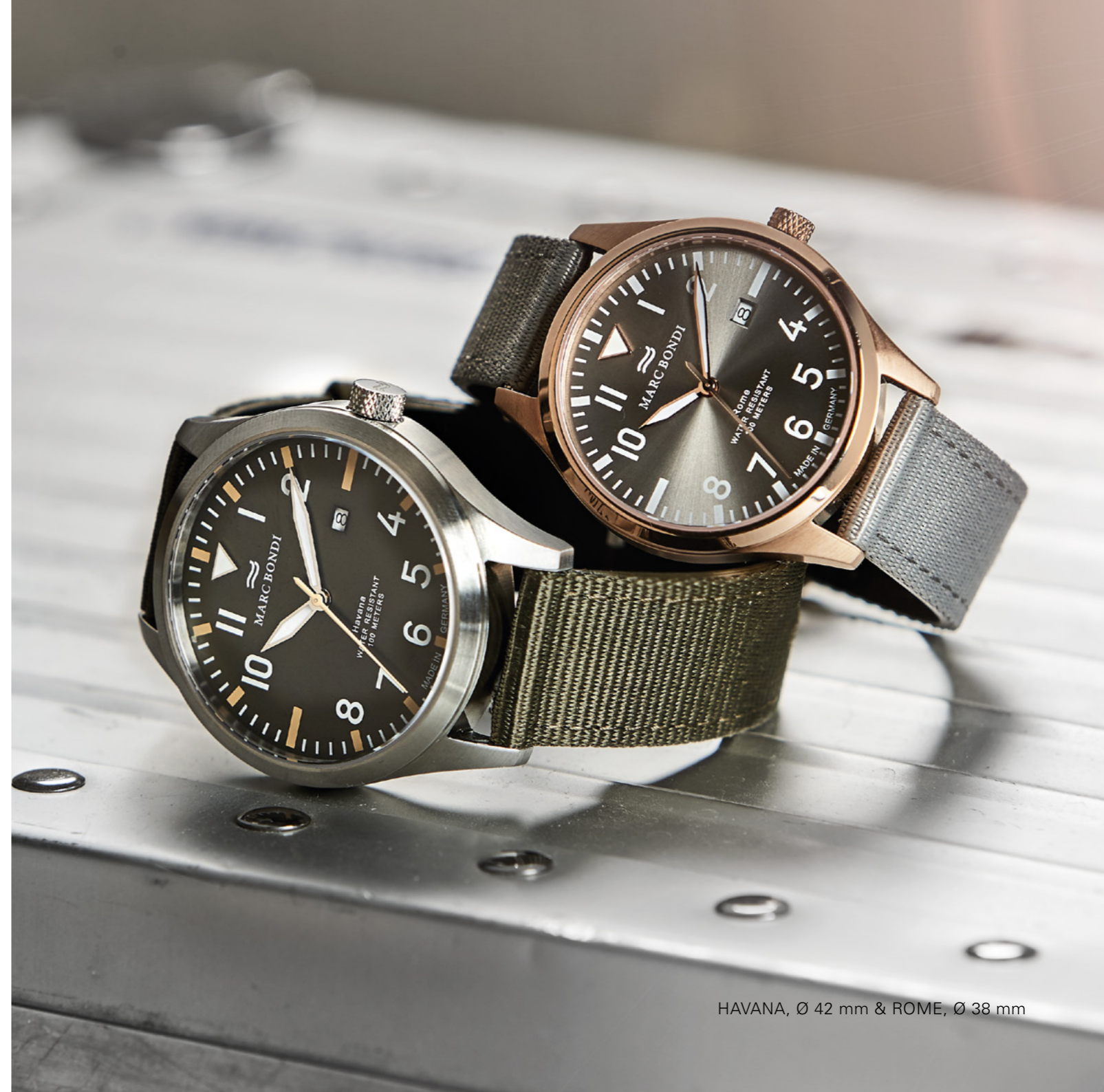
HAVANA, Ø 42 mm & ROME, Ø 38 mm