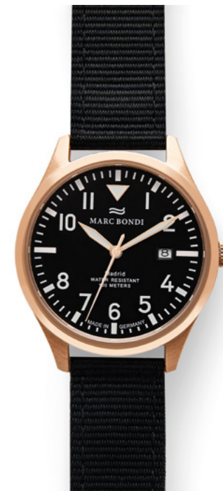
MADRID, Ø 38 mm