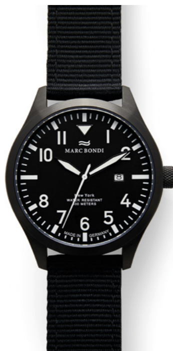
NEW YORK, Ø 42 mm