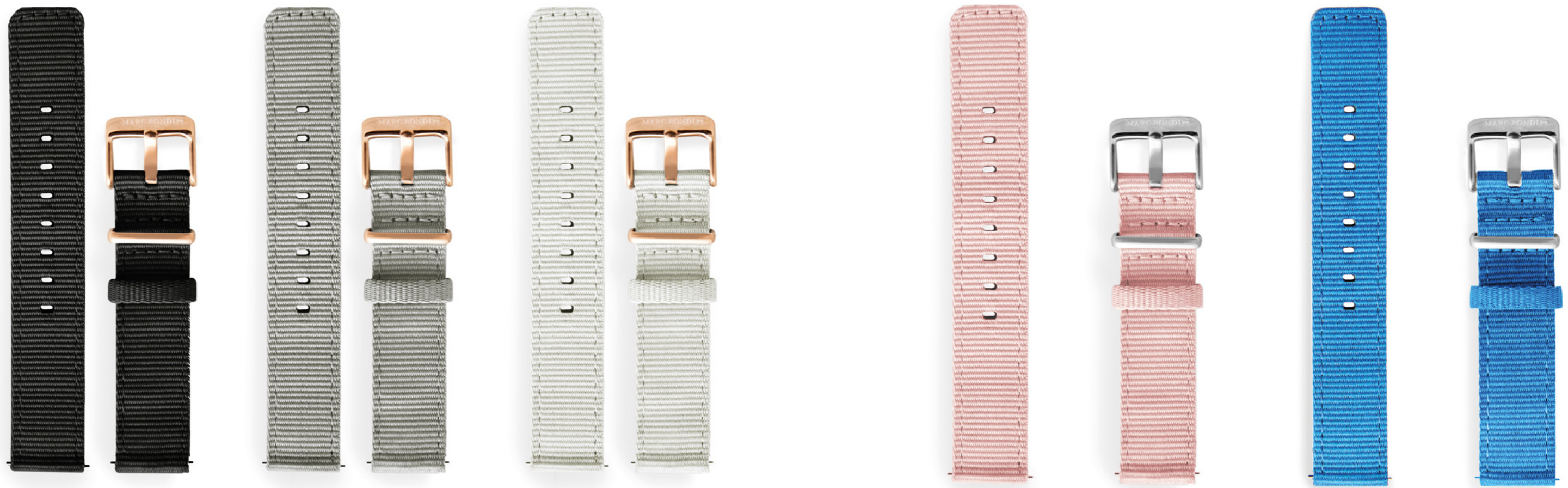
Natoband, Anstoßbreite 18 mm