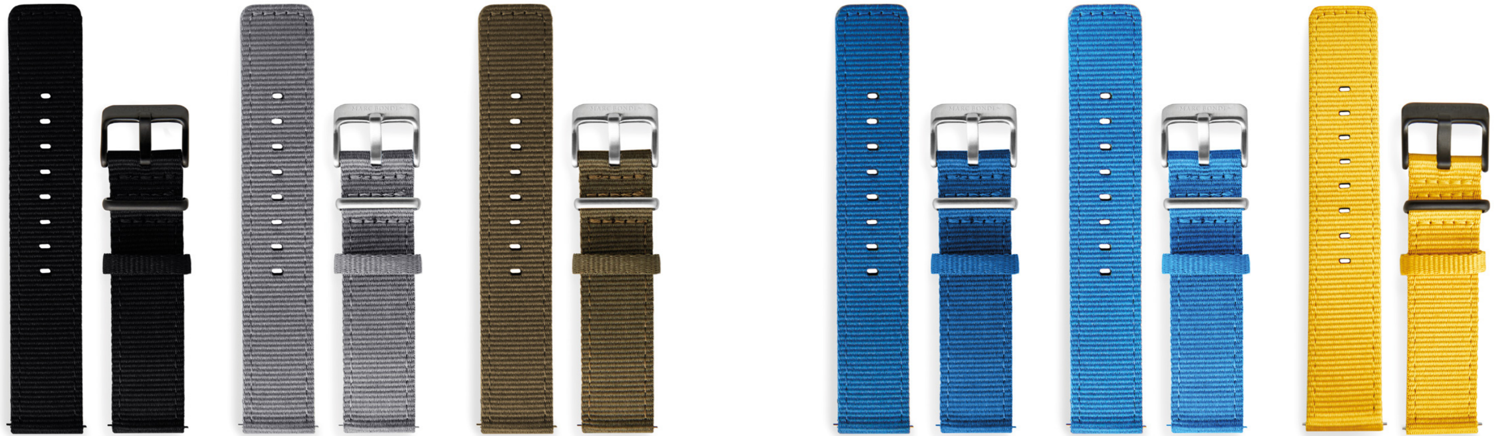
Natoband, Anstoßbreite 20 mm