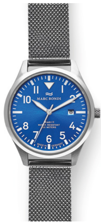
MIAMI I, Ø 42 mm & MIAMI II, Ø 38 mm