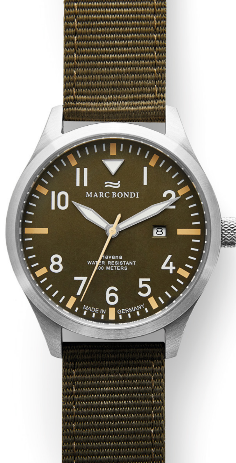
HAVANA, Ø 42 mm