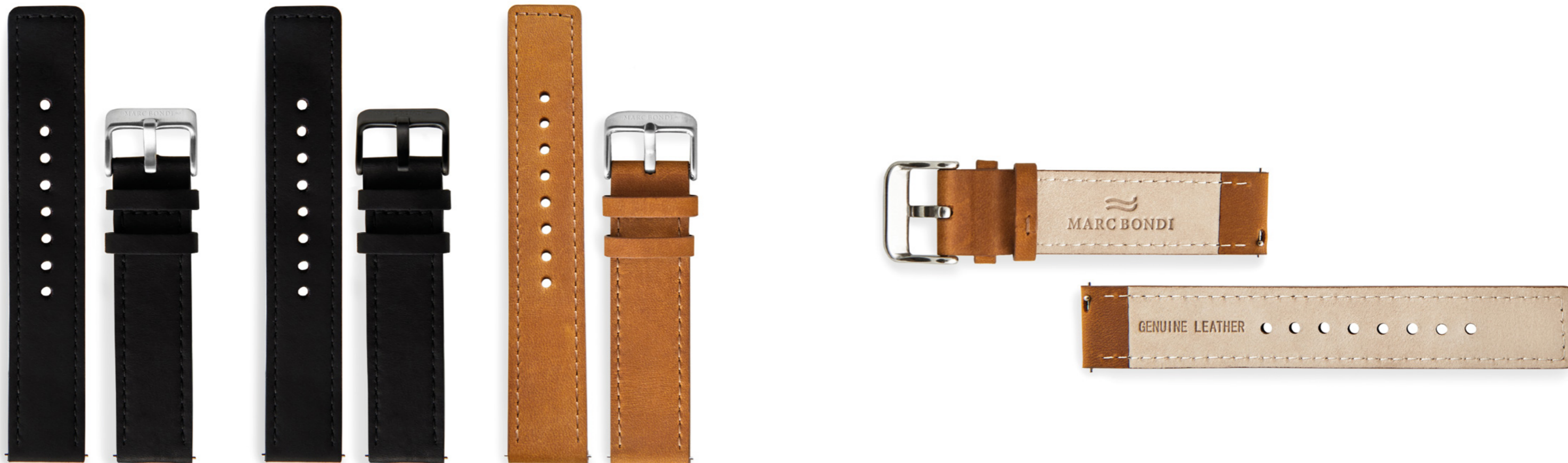
Lederband, Anstoßbreite 20 mm